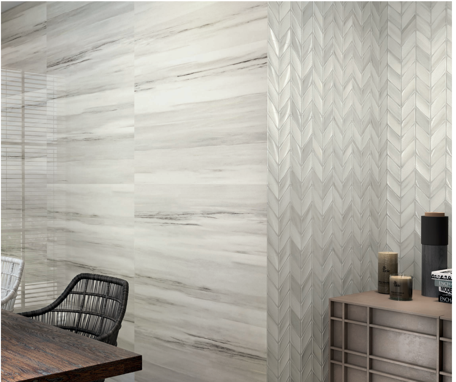
CENDRE Aden Déco Mat (Mur décoratif à droite)