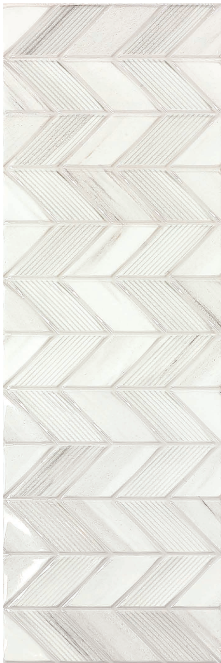
BLANC Aden Déco brillant