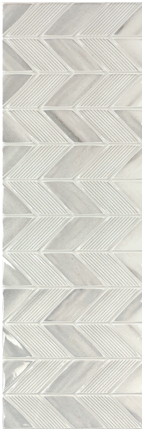
CENDRE Aden Déco brillant